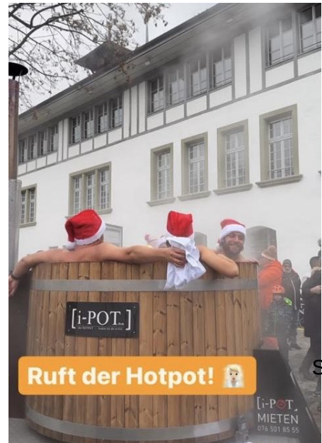
Ruft der Hotpot! 🐼