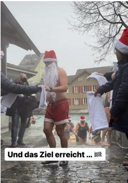
Und das Ziel erreicht ... ❄️